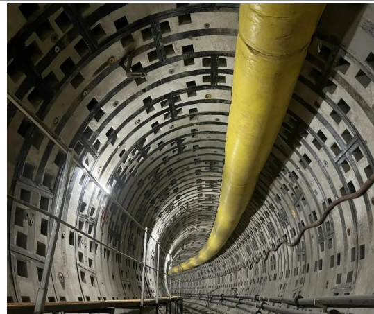
隧道成型照片（5200mm 管片外径）