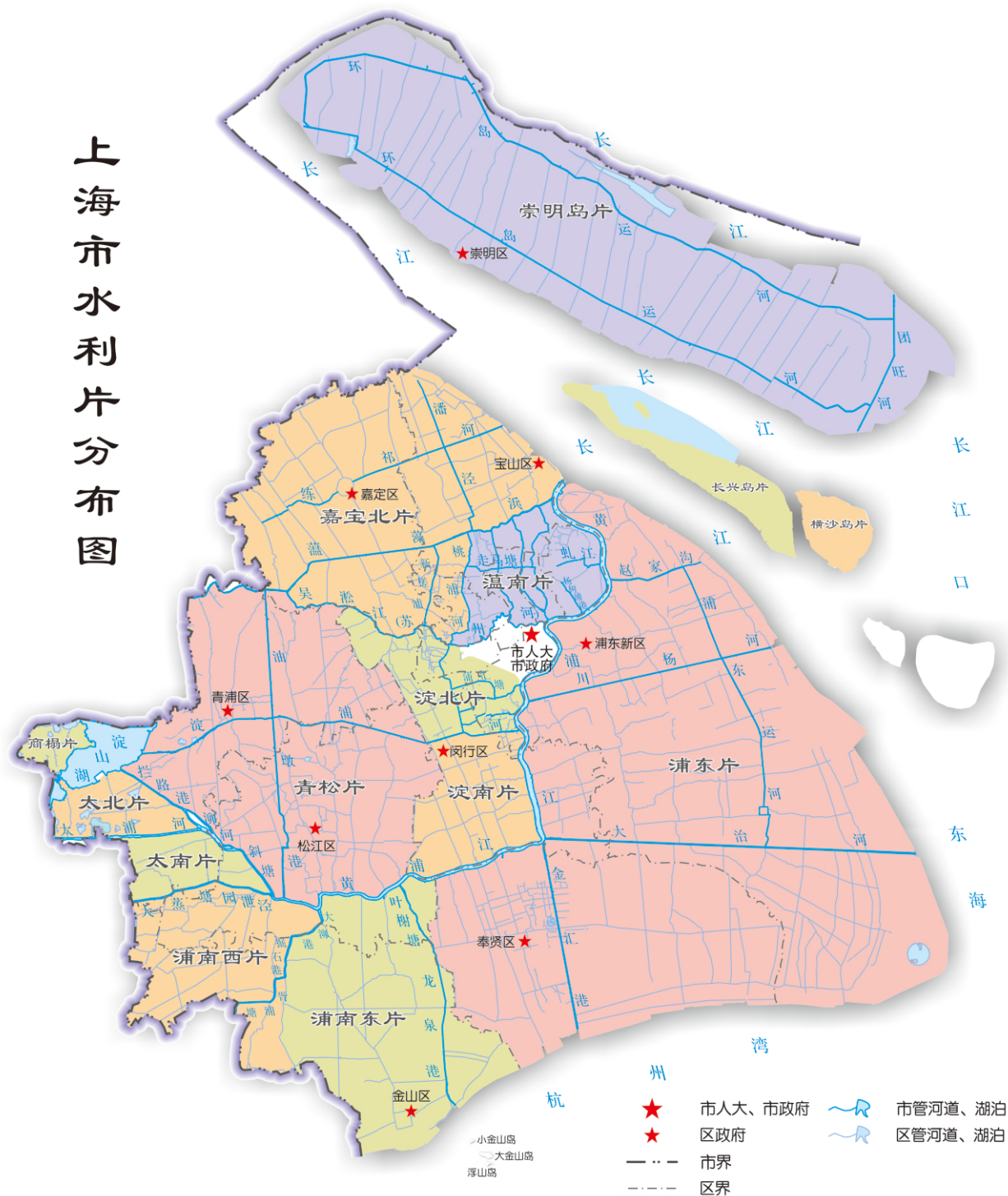
图2 上海市水利片分布图