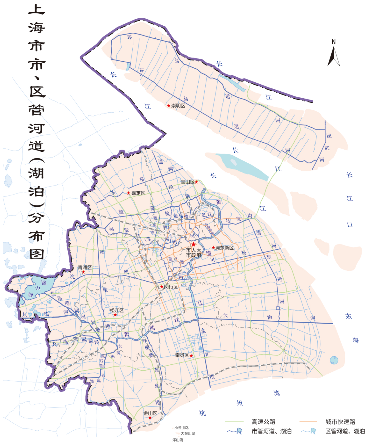
图1 上海市市、区管河道(湖泊)分布图