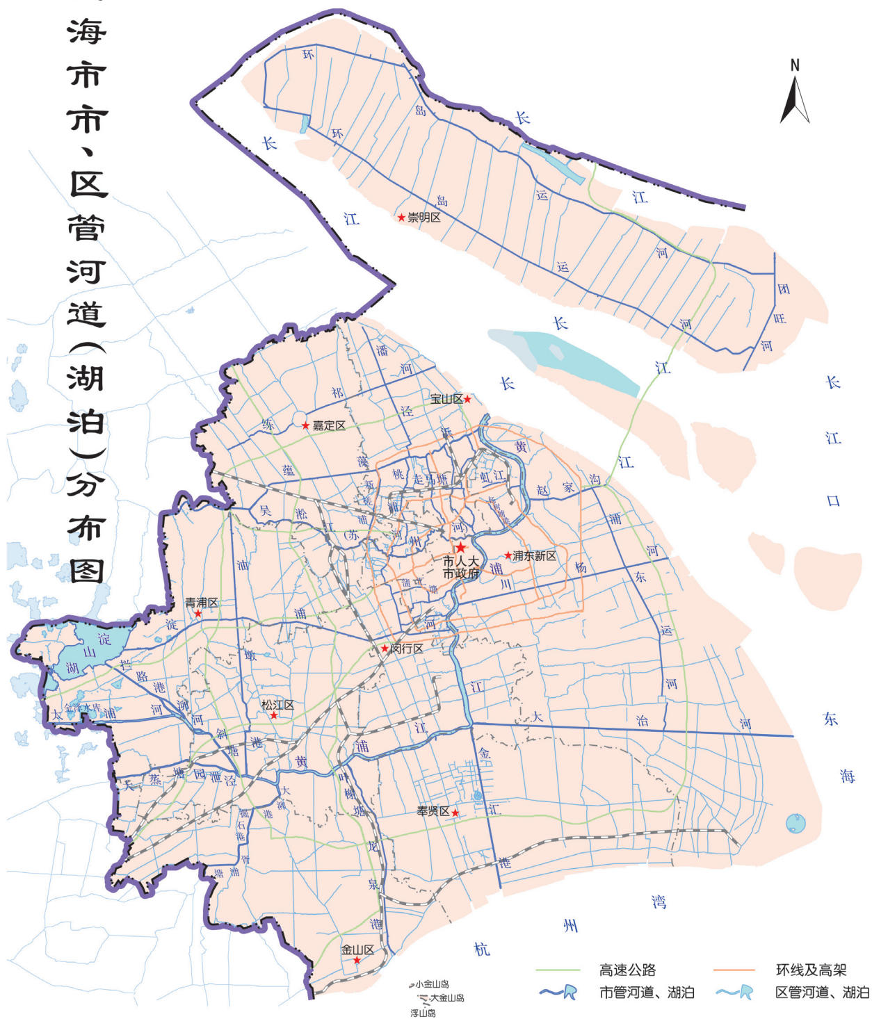
图1 上海市市、区管河道(湖泊)分布图