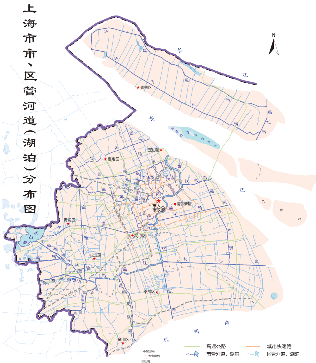
图1 上海市市、区管河道(湖泊)分布图