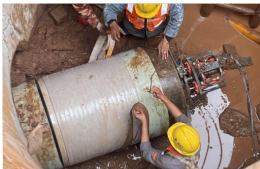
上海市110千伏蒸泽1R021线路迁改工程