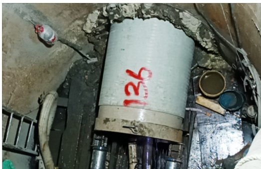
上海市竹园石洞口污水连通管（江杨南路-泰和湾水厂）工程

玻璃纤维增强塑料顶管（连续缠绕工艺），是一种采用连续缠绕工艺成型，由树脂、玻璃纤维（连续+短切）、石英砂组成的新型顶管。顶管中含有轴向增强的短切玻璃纤维提高了管道轴向压缩强度。